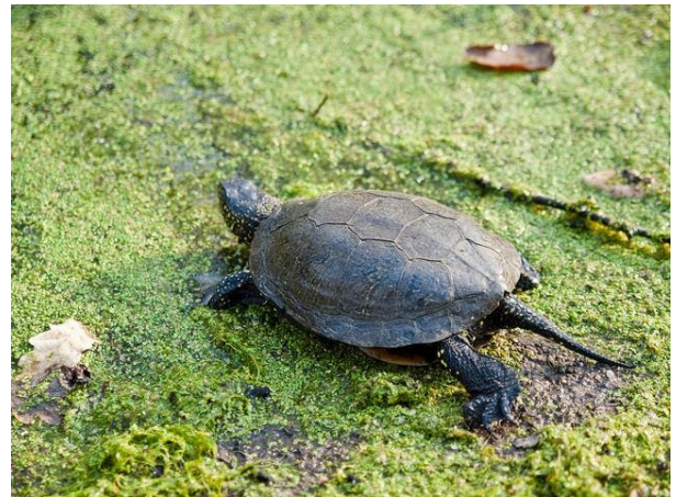
Tortuga d'estany (Emys orbicularis)

Durant el cicle de concerts benèfics EIXIDA s'espera recaptar entre 1.000 i 3.000€ (en funció de les entrades venudes). Aquesta és la proposta d'accions a realitzar per millorar la conservació de la zona descrita: